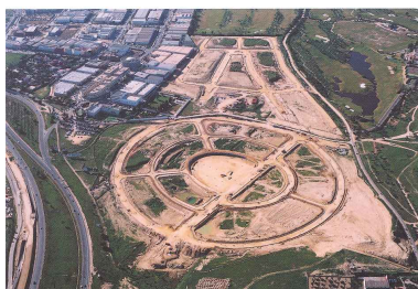
Foto aérea del Parque Empresarial Zaudín.

Inerzia Asesores Inmobiliarios publicó el pasado mes de julio un informe actualizado a tal fecha en el que se analiza la situación actual y futura del mercado de oficinas en la primera corona del Aljarafe sevillano, zona en la que se concentra la mayor superficie de oficinas de todo el área metropolitana de la ciudad de Sevilla.