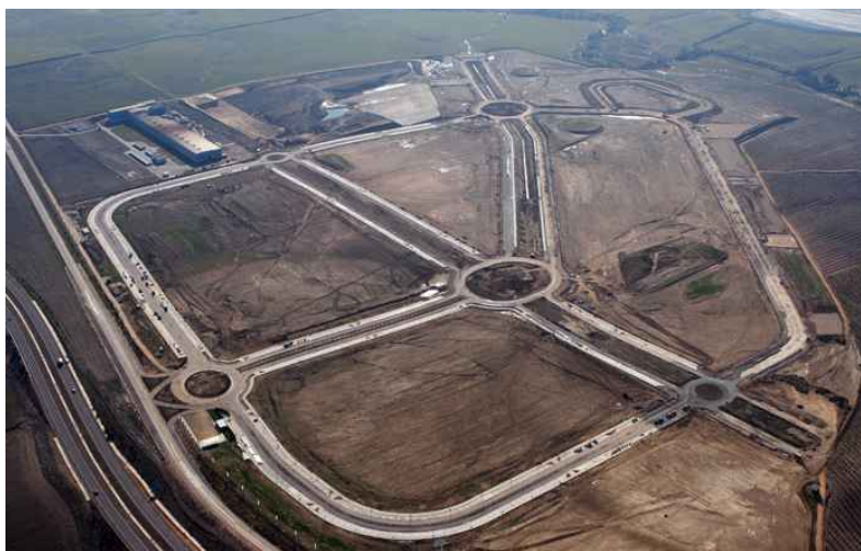
Foto aérea del Parque Industrial y de Servicios El Esparragal

Cristalerías Erasquin es una empresa sevillana cuya actividad principal se centra en la fabricación, almacenamiento y distribución de vidrio. Actualmente, la compañía desarrolla su actividad en el Polígono Industrial Carretera Amarilla, en pleno casco urbano de Sevilla. Con