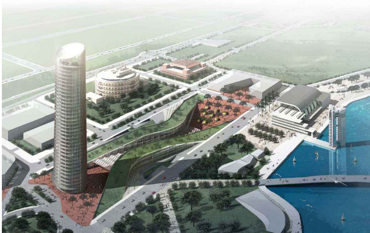
Vista Aérea de Torre Puerto Triana.

Inerzia Asesores Inmobiliarios estudia la demanda de oficinas para el complejo inmobiliario Puerto Triana